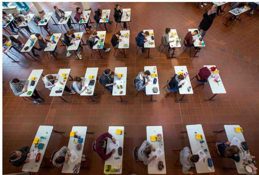
'Niemand weet hoeveel leerlingen een diploma verwerven dat ze niet verdienen.'

taat van die onderwijsvrijheid op een transparante manier gemonitord wordt. Als scholen zo overtuigd zijn van het nut van testen voor de eigen leerlingen, moeten ze dat ook zijn voor de eigen werking. Centrale examens zijn een kostenefficiënte manier om de leerprestaties te verhogen op een sociaal faire manier, en om ernstige problemen te detecteren. Uiteraard moeten deze examens psychometrisch en wetenschappelijk onderbouwd zijn. Als tests echt meten wat leerlingen moeten kunnen dan is teaching to the test net het onderwijs dat we willen. De bestaande initiatieven van de onderwijskoepeles, zoals de interdiocesane, die nu louter voor intern gebruik dienen, kunnen hiervoor als inspiratie dienen. Minister van Onderwijs Hilde Crevits (CD&V) zou beter werk maken van een schoolexamen voor Vlaanderen.