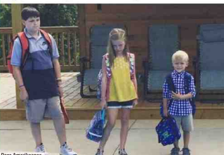
Over Amerikaanse mama's kan haar

waarom zijn ouders zo blij dat het 1 september is? School, dat is toch de ochtendrush, de sleur, het jachtige leven? "Het leven heeft lang genoeg stilgestaan. Tijd dat het weer op gang komt." ROBERT VANDER