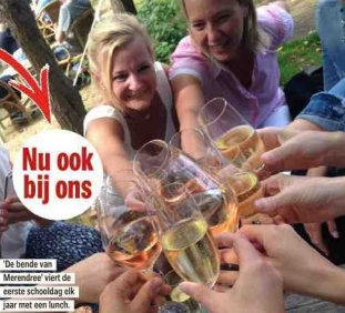
De bunde van Merendree viert de eerste schooldag al met een lunch.

Hoe zit ons politiek systeem in elkaar? Hoe leer ik debatteren? Wat zijn de rechten en plichten in ons land? Vanaf volgend schooljaar leren alle leerlingen uit het gemeenschapsonderwijs dit in een nieuw vak: burgerschap. FABRIEK MABROUK