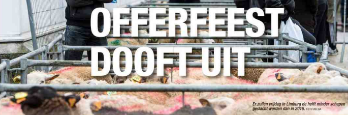
Er zullen vrijdij in Limburg de heft minder schapen geslacht worden dan in 2016.