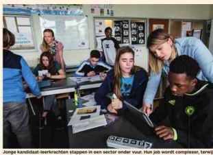
Janje kandidaat-leerkrachten stappen in een sector onder vuur. Hun job wordt complexer, terwijl Vlaanderen terugvalt in de internationalisering van de sector.

LEERKRACHTEN ZIJN OP NIEUW MEER INSTROOM...'