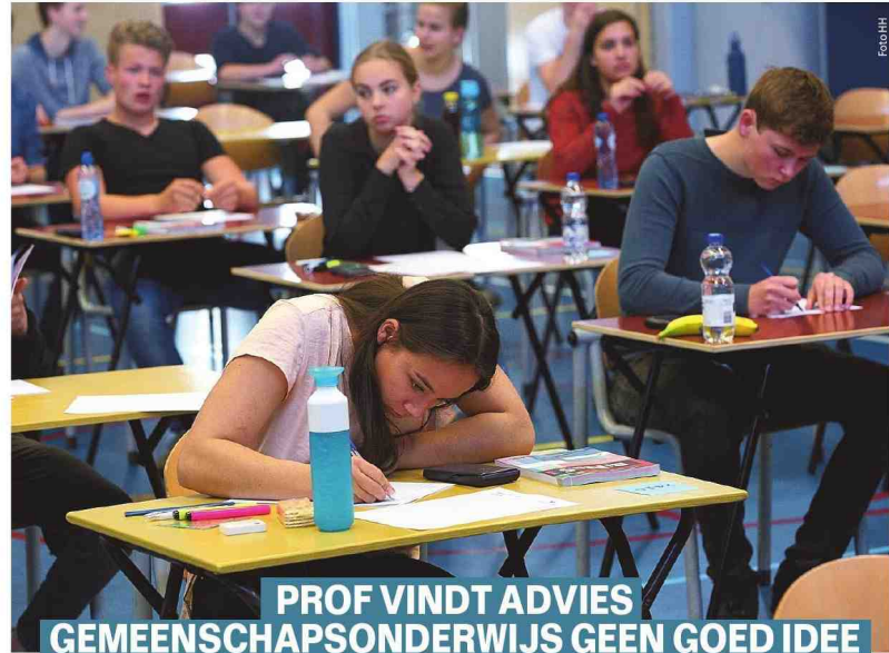
PROF VINDT ADVIES GEMEENSCHAPSONDERWIJS GEEN GOED IDEE

De Belgische kinderartsen benadrukken dat kinderen veilig terug naar school kunnen. Dat stellen ze gezamenlijk na berichten over verschillende gevallen van de Kawasaki-ziekte bij jonge kinderen. Dat is een ziekte waarbij kinderen koorts kunnen ontwikkelen, rode uitslag krijgen, braken en misselijk worden. In ons land zijn er zo een aantal gevallen vastgesteld, net zoals in Frankrijk en Groot-Brittannië. Volgens de kinderartsen is het nog onduidelijk of er een verband is met Covid-19, waarover de huidige wetenschappelijke informatie overigens geruststellend is: slechts weinig kinderen worden er ziek van. «Indien uw kind hoge koorts heeft, of uit slap is, of u om een andere reden ongerust bent, dient u – net zoals anders – contact op te nemen met uw arts», raden ze nog aan.