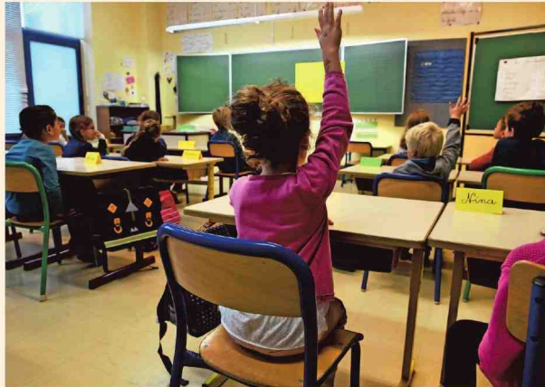
'We moeten nu ingrijpen in het onderwijs', zegt bevoegd minister Ben Weyts (N-VA).

Voor het eerst sinds het begin van de metingen vallen de Vlaamse leerlingen voor leesvaardigheid buiten de top tien van OESO-landen. Terwijl ze in 2015 511 punten behaalden, scoren ze nu nog 502. Het