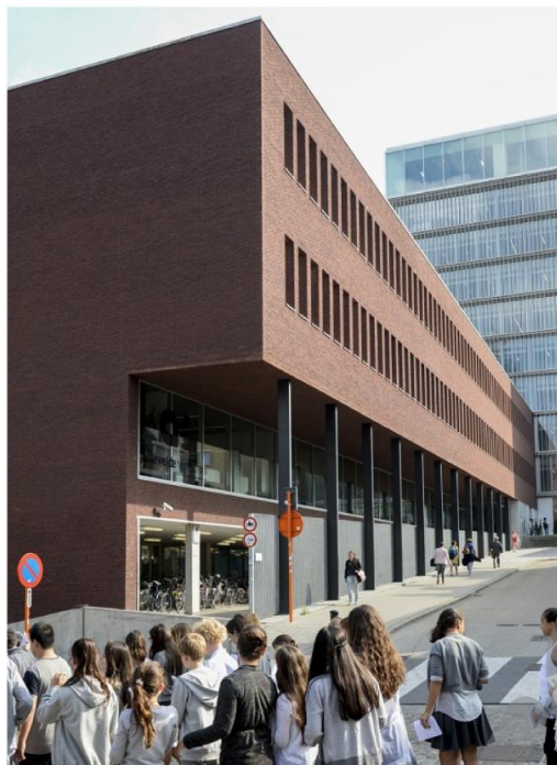
De Artevelde- en Odisee hogeschool slaan de handen in elkaar. 'We willen nadenken over een ander soort hoger onderwijslandschap.'

ONDERWIJS De Arteveldehogeschool en Odisee hogeschool gaan intensief samenwerken. Een opvallende zet, want de twee behoren tot een andere associatie. 'Op sommige vlakken, zoals artificiële intelligentie, wordt het financieel en logistiek onmogelijk om alles zelf uit te werken.'