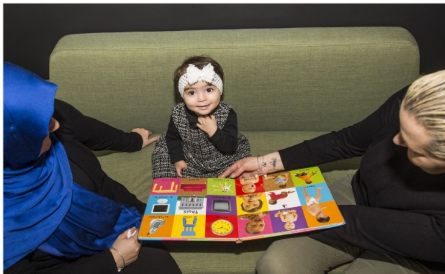
In het basisonderwijs bestaat er vandaag geen uniformiteit in de aanpak van anderstalige kinderen.

Wat bedoelt minister Weyts met zijn taalbadklas na de derde kleuterklas? Het woord 'taalbad' suggereert een complete onderdompeling in een Nederlandstalig milieu. Als dat de