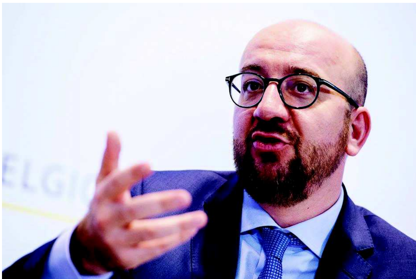
Premier Charles Michel (MR).

De economische resultaten van de regering-Michel vertellen pas echt iets als je ze vergelijkt met die van onze buurlanden en de rest van Europa. Op verzoek van Knack selecteerde econoom Gert Peersman (UGent) vijf parameters om het economisch beleid van de regering te beoordelen: de economische groei, de werkgelegenheid, de concurrentiekracht, de koopkracht en de begroting.