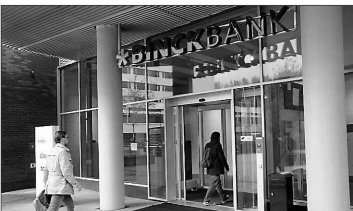
• Binck zou nog een malafide vermogensadviseur hebben gefaciliteerd.

Het nieuwe beleggings-schandaal, waarbij enkele bekende Nederlanders zouden zijn gedupeerd, vertoont veel overeenkomsten met de fraude waarvoor beleggingsadviseur Rob van den B. uit Gemert begin deze maand werd gearresteerd. Van den B. wordt verdacht van een miljoenenfraude, waarbij hij vermogende particulieren €9 miljoen ontfoetselde door torenhoge rendementen te betalen uit de inleg van andere beleggers. Hij gebruikte hiervoor even-