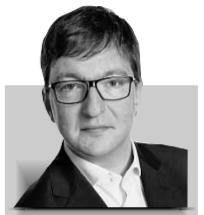
door MARTIN VISSER

Eurocommissaris Barnier van Interne markt noemde het vorige week 'een mijlpaal' dat formeel is besloten de ECB tot toezichthouder op het bankwezen te bombarderen. Nogal grote woorden. Op zijn best is het een mijlpaaltje en nog een wankele oek. Want wat los je er nu mee op om het toezicht op de Nederlandse banken te verplaatsen van Amsterdam naar Frankfurt? Niets.