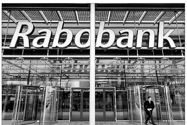
• Bij Rabobank moet men de kaken nog even verplicht op elkaar houden over het schandaal.

Die totale voorziening voor de schikking die Rabobank op dat moment voorzorg, staat daarom in het halfjaarverslag opgenomen onder de verzamelpost 'overige schulden'. Die post nam tussen 31 december 2012 en 30 juni 2013 toe van €11.077 miljoen naar €11.883 miljoen, een verschil van €806 miljoen. Maar daarin zitten