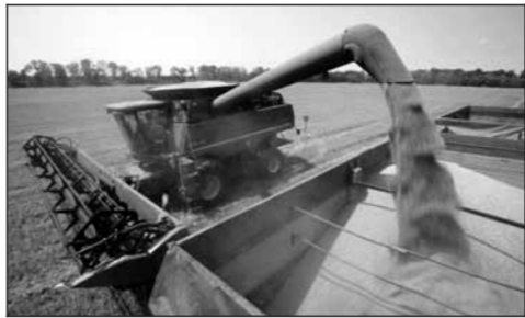
• Glencore naar Drenthe.

Ben Blog is de drijvende kracht achter Graaco, de lokale agrologistieke onderneming die inmiddels 30 voetbalvelden vol terminals heeft, maar nog geen 5 jaar bestaat. Hij is in zijn nopjes met de vestiging, 'omdat de beperkte capaciteit die de Betuwelijn de komende jaren heeft, door ons