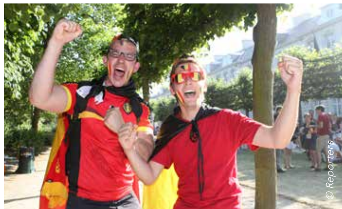
Filip kan op twee oren slapen. Er zijn geen (echte) republikeinen meer.

Nieuw in vergelijking met 1993 is dat de politieke tegenstelling over de monarchie bijna helemaal samenvalt met het communautaire dispuut. Vlaamsgezinden zijn automatisch tegen de (Belgische) monarchie. Belgischgezinden zijn er automatisch voor. Dit maakt dat het monarchiedebat niet meer op een zuivere manier kan wor-