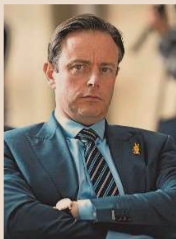
Bart De Wever.

Als de N-VA federaal aan de macht komt, wil ze onmiddellijk een reeks 'pestbelastingen' terugdraaien. Ze denkt daarbij aan de geplande hogere belasting op de liquidatiebonus, het strengere regime voor bedrijfswagens en de monsterboetes van 309 procent. Maatregelen die volgens de N-VA stuk voor stuk kwaad bloed hebben gezet bij ondernemers en zelfstandigen. De afschaffing van de drie pestbelastingen kost volgens de N-VA 115 miljoen euro. Voorts wil ze bedrijven vijf jaar fiscale zekerheid geven door met de ondernemerswereld een 'fiscaal pact' af te sluiten.