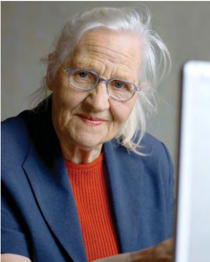
Door andere vaardigheden uit te spelen of levenslang te leren kun je je productiviteit op peil houden.