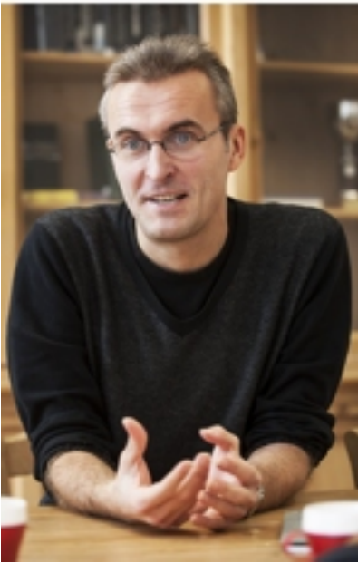
'Ik durf de problemen onder ogen te zien.'

anderzijds van de werkgelegenheidsgraad, waar we heel slecht scoren. Eén procent hogere werkgelegenheidsgraad, betekent 0,75 procent minder vergrijzingskosten. Langer werken, en de inefficiënties uit de arbeidsmarkt halen, dat is de sleutel.'