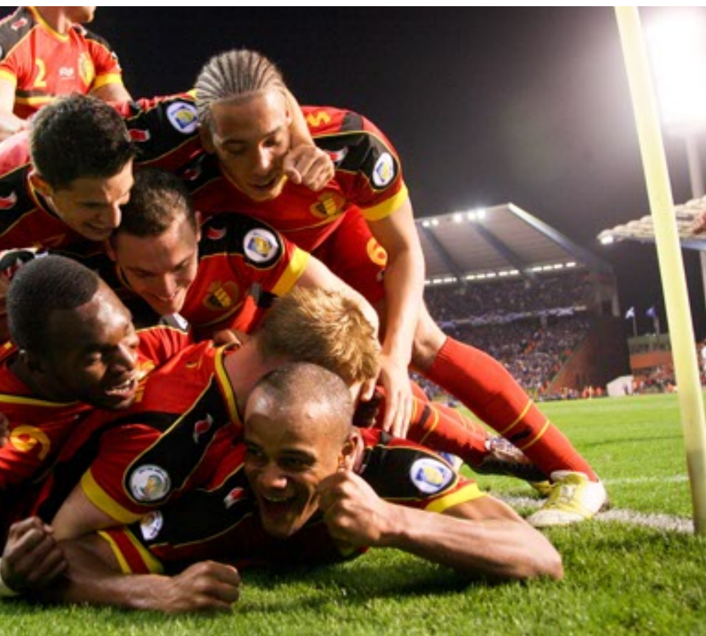
ploegmaats na een magistraal doelpunt in de heenmatch tegen Schotland.

met mensen die dat niet oké vinden'. Je vindt het nu bij Kompany, maar ook bij Stromae en de broertjes Borlée. Open, inclusief en zelfs een beetje speels, is deze belgitude het antivirus voor een smal en gesloten centennationalisme. Verbinden in plaats van verdelen. Met een knipoog in plaats van een vermanend vingertje. De moderne belgitude is ook niet een soort van een hoogdravend kosmopolitisme. De belgitude laat net de keuze en de openheid voor eenieder hoogstpersoonlijke identiteit. Je kunt je ergens goed bij voelen en deel van verschillende gemeenschappen tegelijk. Je stad én Vlaanderen, of je dorp én België, of Vlaanderen én België, waarom zou dat niet kunnen? Kiezen tussen België en Vlaanderen is passé, zowel naar identiteit als institutioneel.