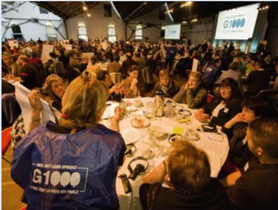
'Was de G1000, directe democratie in de praktijk, dan niet gemeenschapsvormend?' ©put

Een column schrijven waarin het wemelt van wijsheden en filosofen, maar dan zeggen dat je niet veel kunt met filosofen 'omdat je daar te dom voor bent', is volksverlakkerij